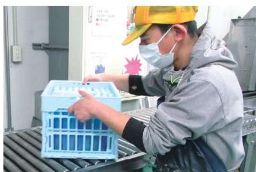
液もれている蓄冷材は 取り除き洗浄します。