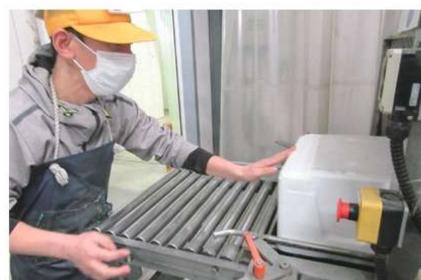
汚れが目立つシッパーを 洗浄します。