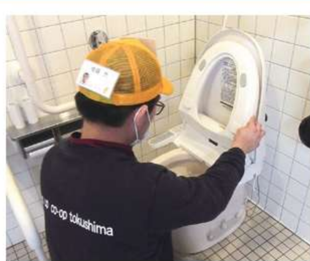
廊下・トイレや 物流センター 周辺を掃除します。