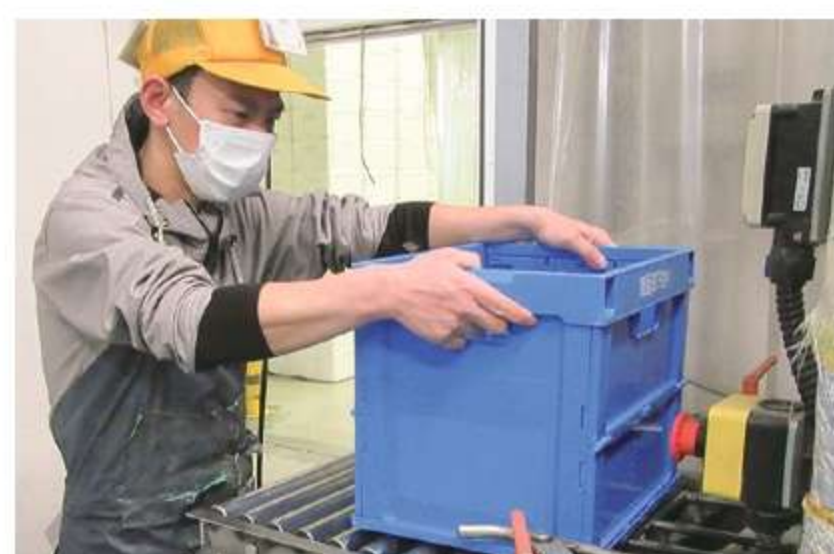
コンテナを洗浄機にかけます。