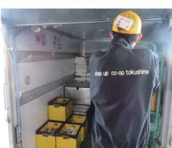
配送後のトラックの 空箱などを 種類ごとに分けて 整理整頓します。